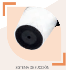
SISTEMA DE SUCCIÓN