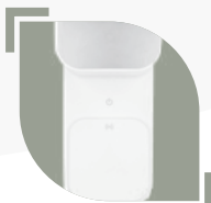
BASE DE CARGA